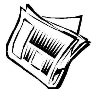
Flyer Verkehr/ Traffic