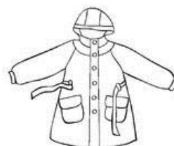
Regenjacke / Rainwear