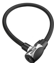
Schloss / Lock