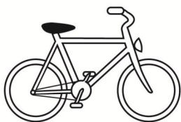
Fahrrad / Bicycle

Im Kaufpreis inbegriffen / Included (ankreuzen):