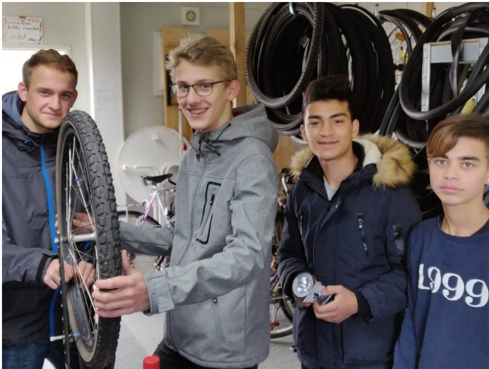
Bild 2- Workshop in der Radwerkstatt am Standort Paffrath

Der "Mobile Nachbarn - Initiativen Verbund GL"* unterstützte in einer neuen Kooperation erstmalig die Jugendabteilung des Mountainbike Rhein Berg e.V. mit technischen Workshops.