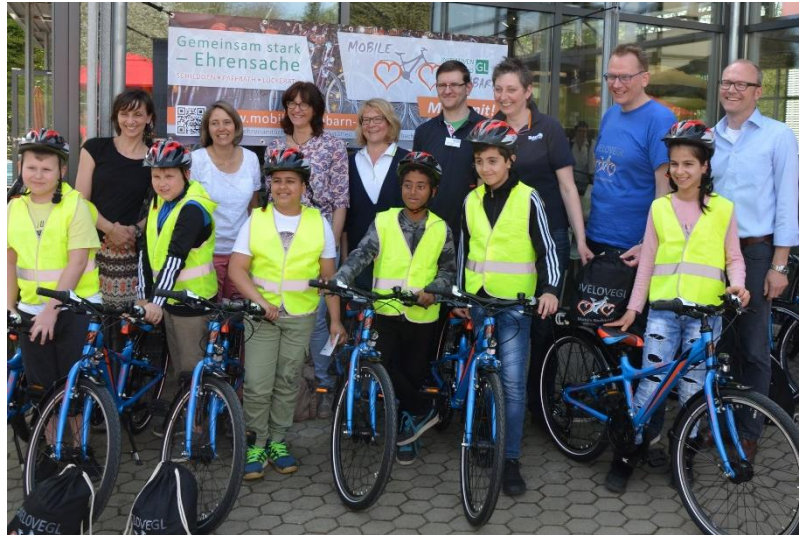
Bild 1 – Fahrradübergabe, Aktion "Mobilität erlernen" im April 2018

Dauer des Projekts: Frühjahr 2019 Finanzrahmen: ca. 4000,- EUR